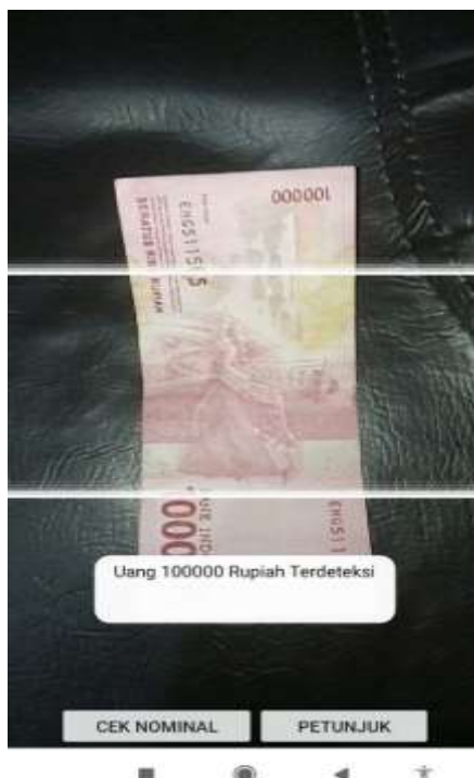
Gambar 2. Tampilan Aplikasi Pendeteksi Nominal Uang Kertas Rupiah

Aplikasi menyediakan fitur yang mencakup dua tombol utama, yaitu "Cek Nominal" dan "Petunjuk", serta menggunakan perangkat kamera smartphone untuk menampilkan gambar, seperti pada Gambar 2.