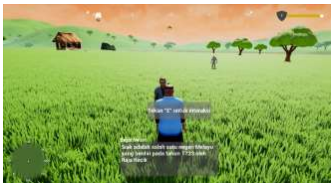
Gambar 5. Tampilan Interaksi

Gambar 5 merupakan tampilan yang menampilkan interaksi antara karakter utama dan karakter NPC .