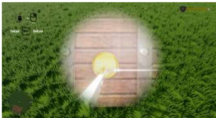
Gambar 9. Tampilan Puzzle