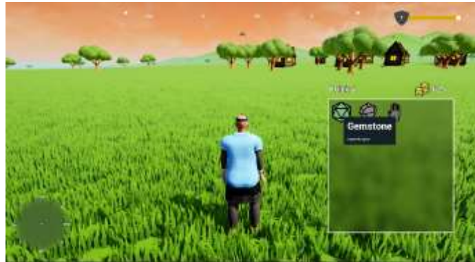
Gambar 6. Tampilan Inventory

Gambar 6 merupakan tampilan yang berfungsi untuk menampilkan informasi tentang detail dari barang atau item yang telah dikoleksi oleh karakter utama.