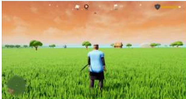
Gambar 4. Tampilan Game Play

Tampilan game play yang menampilkan beberapa fitur seperti Health Point (HP) dan Experience Point (EXP) karakter utama yang berfungsi memberikan informasi tentang keadaan karakter saat ini. Kemudian ada fitur Kompas sebagai acuan arah. Dan ada fitur Mini Map yang berfungsi memberikan informasi tentang lokasi player .