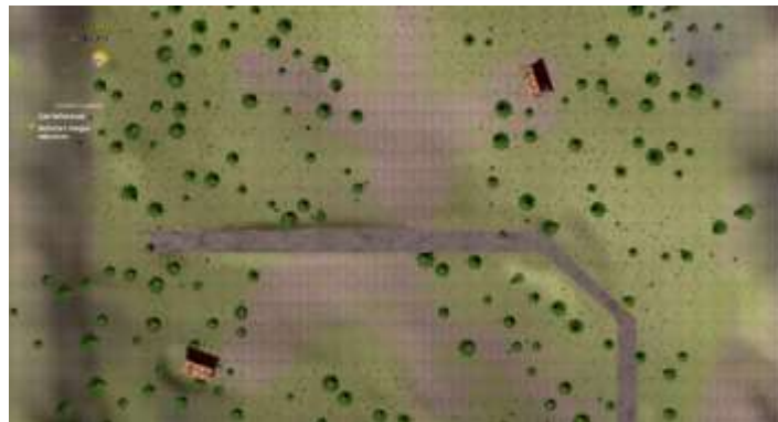
Gambar 7. Tampilan Map / Peta

Gambar 7 merupakan tampilan informasi tentang peta dunia didalam game. Selain menampilkan peta, juga menampilkan informasi waktu pada dunia game tersebut dan juga informasi tentang quest atau misi yang sedang dikerjakan oleh karakter utama.