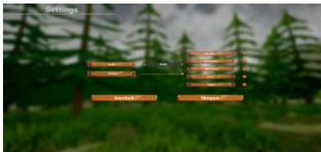
Gambar 3. Tampilan Pengaturan

Pengaturan merupakan antarmuka yang digunakan pemain untuk bisa memilih memiliki beberapa fitur, seperti fitur grafik yang berfungsi untuk mengatur kualitas grafik dari game . Kemudian ada fitur volume yang berfungsi untuk mengatur suara dari game . Selanjutnya ada fitur kompas yang berfungsi untuk menampilkan atau menyembunyikan tampilan kompas pada game play . Kemudian ada fitur peringatan yang berfungsi untuk menampilkan atau menyembunyikan informasi peringatan pada game play . Selanjutnya fitur Mini Map yang berfungsi untuk menampilkan atau menyembunyikan tampilan Mini Map pada game play . Kemudian ada fitur level yang berfungsi untuk menampilkan atau menyembunyikan informasi level pada game play . Kemudian ada fitur waktu yang berfungsi untuk menampilkan atau menyembunyikan informasi waktu pada game play .