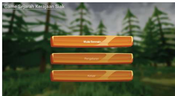
Gambar 2. Tampilan Main Menu

Menu utama merupakan antarmuka yang digunakan pemain untuk bisa memilih untuk memulai game , pengaturan atau keluar dari game .