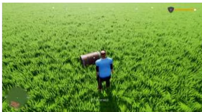
Gambar 8. Tampilan Buka Peti

Gambar 8 dan Gambar 9 merupakan tampilan puzzle yang harus diselesaikan pengguna untuk mendapatkan Item hadiah yang ada didalam peti. Pada tampilan ini terdapat juga petunjuk untuk mengerjakan puzzle tersebut.