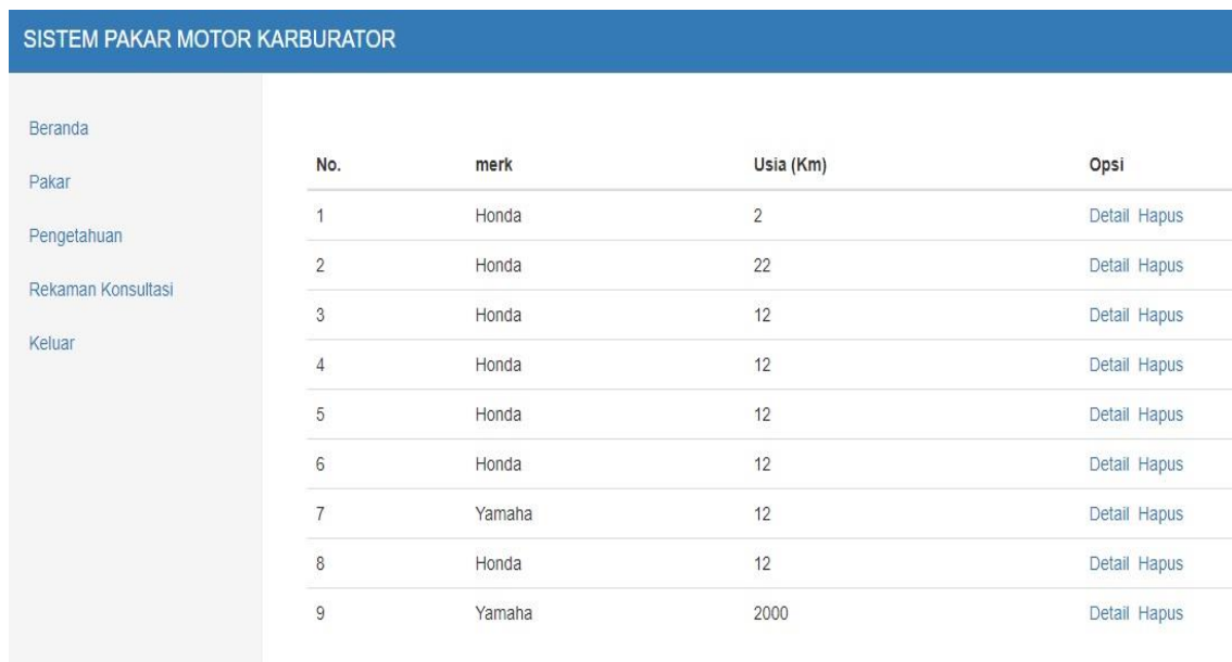
Gambar 4. Model Tampilan Antarmuka Rekaman Konsultasi