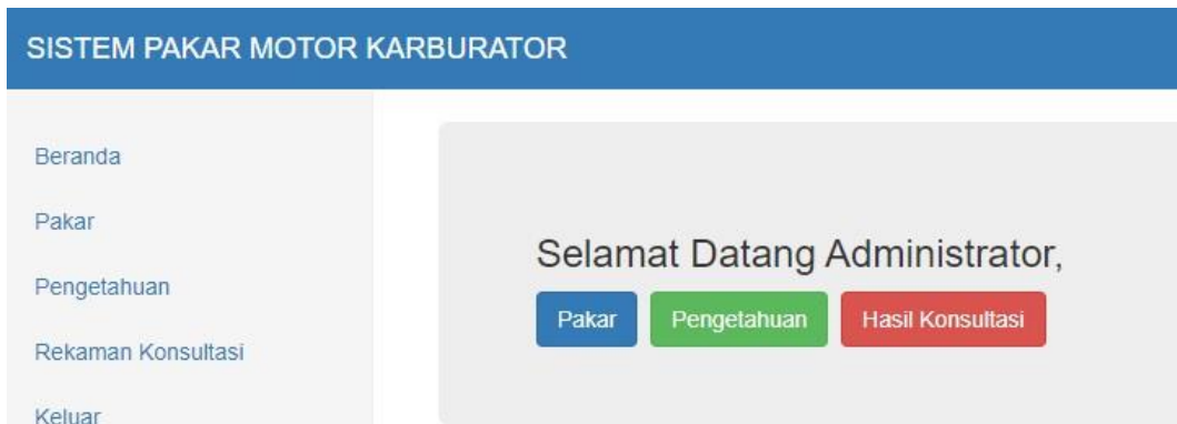
Gambar 2. Model Tampilan Antarmuka Utama Sistem