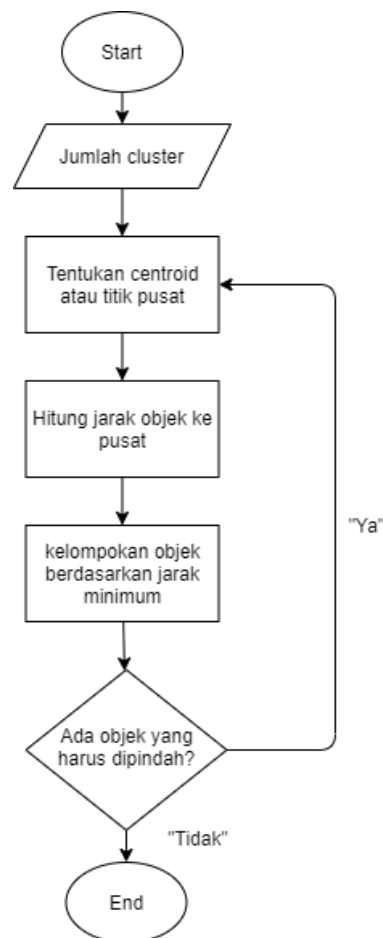
Figure 2. Flowchart Klasterisasi dengan Algoritma K-Means

Adapun proses alur dari metode K-Means cluster adalah sebagai berikut: