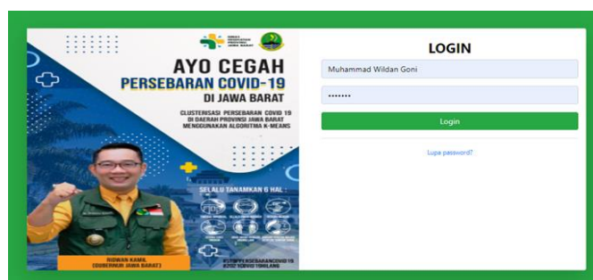
Figure 4. Tampilan Halaman Login

Halaman login merupakan halaman yang pertama muncul ketika mengakses sistem ini. Pada halaman ini, admin harus menginput username dan password sebelum menjalankan aplikasi.