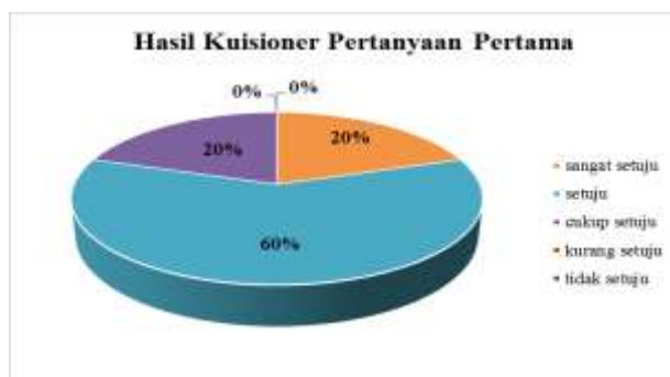
Gambar 6. Hasil Kuisisioner Pertama