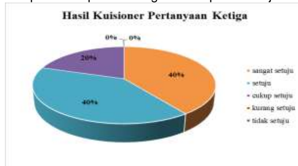
Gambar 8. Hasil Kuisisioner Ketiga

Dari grafik gambar 8 hasil kuisisioner pertanyaan ketiga di atas, dapat dilihat bahwa hasil dari kuisisioner tersebut yaitu warna jingga sebesar 40 % (sangat setuju), warna biru sebesar 40% (setuju), dan warna ungu sebesar 20% (cukup setuju).