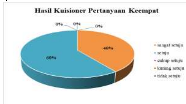
Gambar 9. Hasil Kuisisioner Keempat