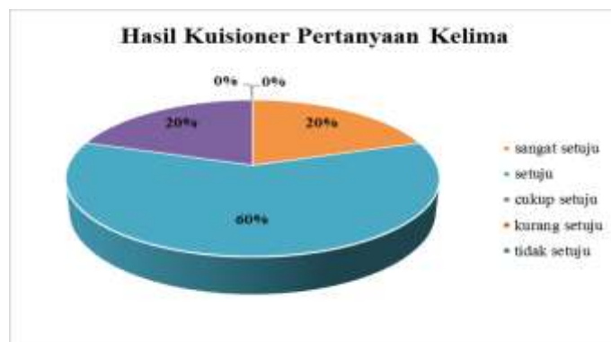
Gambar 10. Hasil Kuisioner Kelima

Dari grafik gambar 10 hasil kuisioner pertanyaan kelima di atas, dapat dilihat bahwa hasil dari kuisioner tersebut yaitu warna jingga sebesar 20 % (sangat setuju), warna biru sebesar 60% (setuju), dan warna ungu sebesar 20% (cukup setuju).