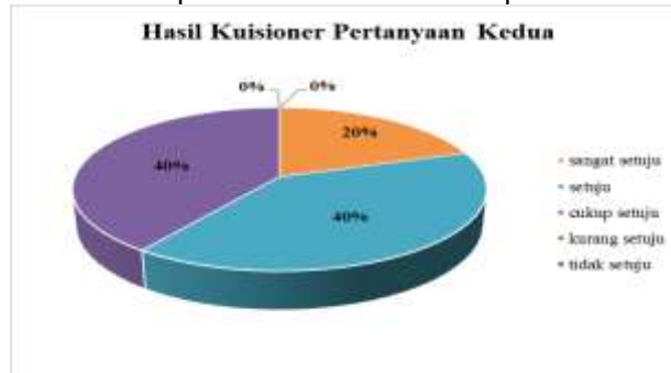
Gambar 7. Hasil Kuisisioner Kedua

Dari grafik gambar 7 hasil kuisisioner pertanyaan kedua di atas, dapat dilihat bahwa hasil dari kuisisioner tersebut yaitu warna jingga sebesar 20 % (sangat setuju), warna biru sebesar 40% (setuju), dan warna ungu sebesar 40% (cukup setuju).