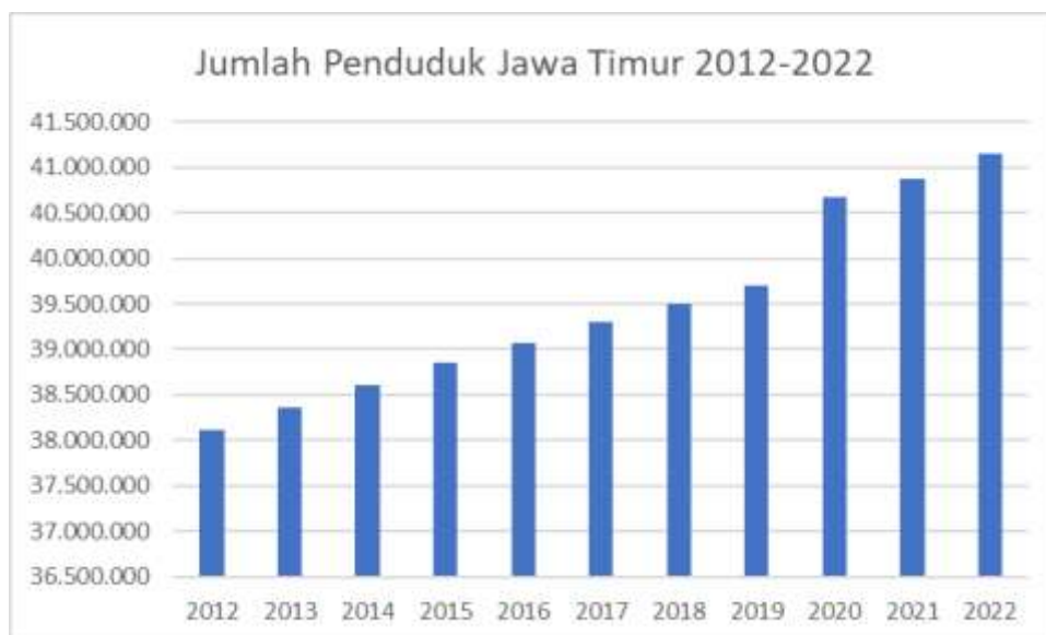
Gambar 2. Data Aktual Penduduk Jawa Timur

Dalam Gambar 1, terdapat representasi visual dari data aktual mengenai produksi padi mulai dari tahun 2012 hingga 2022. Grafik ini menggambarkan fluktuasi produksi selama 10 tahun terakhir. Produksi mencapai puncaknya pada tahun 2016, mencapai 13.969.789,000 Ton. Namun, terjadi penurunan signifikan pada tahun 2019, di mana luas panen mencapai angka terendah dalam periode tersebut, yakni 9.580.933,880 Ton.