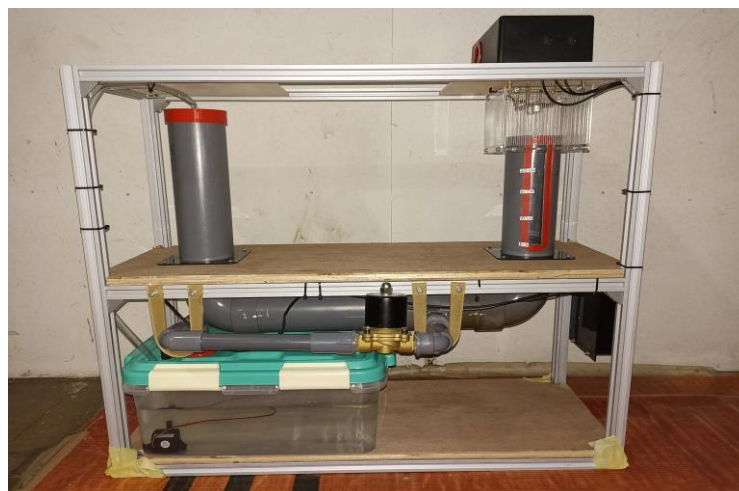
Gambar 3 Prototype alat bagian depan

Hasil dari prototype tampak depan ialah rancangan dari alat pendeteksi banjir. di bagian ini suatu desain yang memperlihatkan beberapa bagian seperti pipa berukuran kecil dan box pelastik. Dimana setiap bagian yang pada desain di prototype ini memiliki peran serta fungsi masing-masing yang berbeda.