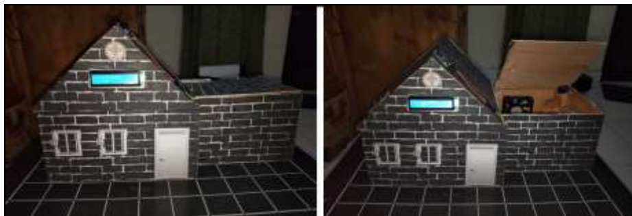
Gambar 6 Posisi Atap Tertutup Dan Terbuka

Pada sistem kendali dan mekanik menggunakan motor servo dipadu dengan arduino uno, beradboard, relay module 2 channel, kipas dc dan bohlam 100w. Ditenagai listrik dari PLN kemudian di konversi menggunakan adaptor ac/dc.