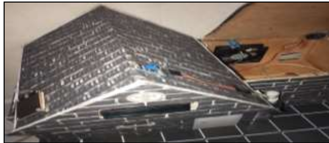
Gambar 4 Penempatan sensor hujan, ldr, dan dht11