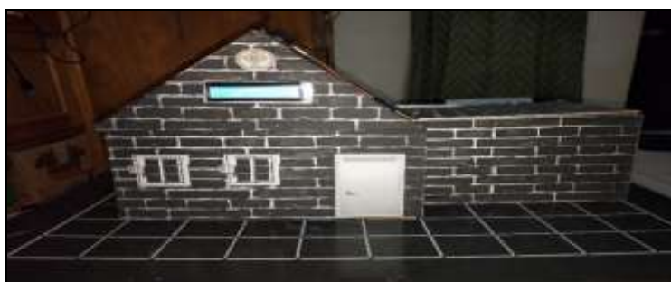
Gambar 3 Bentuk miniatur rumah tampak depan

Dari rancangan penelitian diatas, dapat dihasilkan sebuah sistem Prototype Jemuran Dan Pengering Buatan Otomatis Berbasis Mikrokontroler Arduino Uno yang diimplementasikan kedalam sebuah miniatur rumah atau prototype: