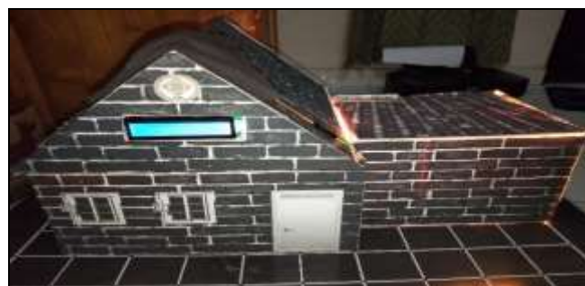
Gambar 7 Keadaan saat pengering menyala

Pada gambar diatas menunjukkan posisi atap terbuka dan tertutup, mekanisme sistem atap pada penelitian adalah dengan teknik buka tutup dari atas kebawah.