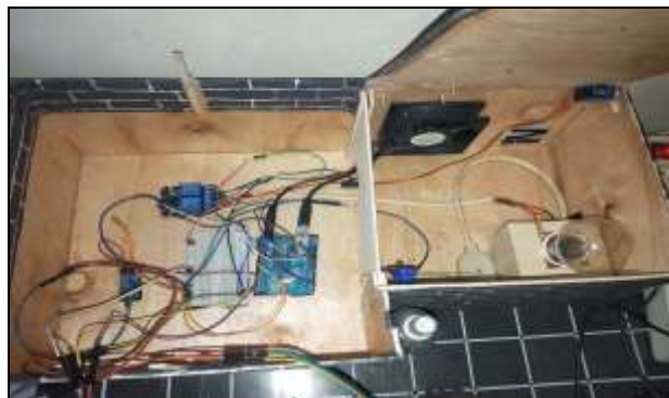
Gambar 5 Penempatan Mekanik dan Sistem Elektronik

Pada sistem kendali dan mekanik menggunakan motor servo dipadu dengan arduino uno, beradboard, relay module 2 channel, kipas dc dan bohlam 100w. Ditenagai listrik dari PLN kemudian di konversi menggunakan adaptor ac/dc.