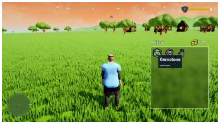
Gambar 12. Tampilan Detail Koleksi

Gambar 12 merupakan tampilan yang berfungsi untuk memberikan informasi tentang detail dari barang atau item yang telah dikoleksi oleh karakter utama.