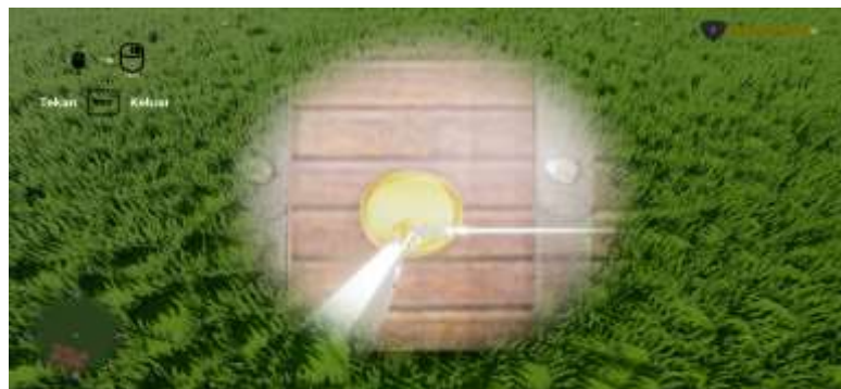
Gambar 15. Tampilan Puzzle

Pada gambar 15 merupakan tampilan puzzle yang dapat diselesaikan pengguna untuk mendapatkan hadiah didalam peti. Pada tampilan ini terdapat juga petunjuk untuk mengerjakan puzzle tersebut.