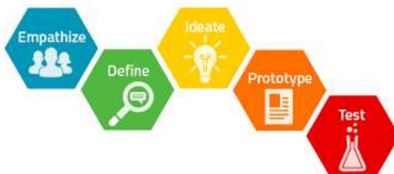
Gambar 1. Tahapan Metode Design Thinking

Metode yang digunakan dalam penelitian ini yaitu menggunakan metode Design Thinking , Metode Design Thinking merupakan metodologi yang mencari solusi dari suatu permasalahan dengan cara pendekatan sehingga dapat menyelesaikan masalah dengan mudah dan kreatif yang difokuskan pada pengguna. Metode ini memecahkan masalah dengan berusaha memahami pengguna, sehingga dapat memenuhi kebutuhan dari pengguna tersebut. Dalam metode ini memiliki 5 tahapan yaitu [9]: