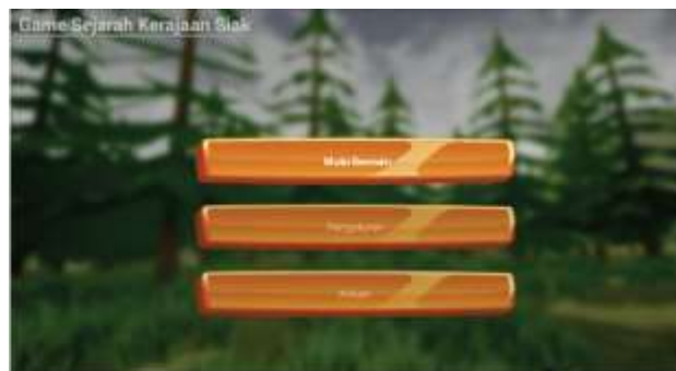
Gambar 5. Tampilan Main Menu