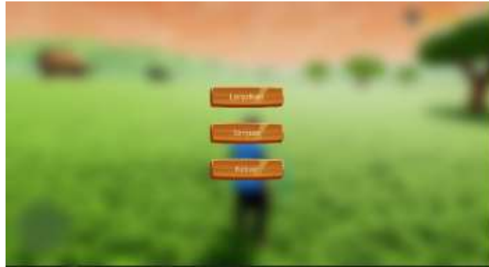
Gambar 8. Tampilan Pause