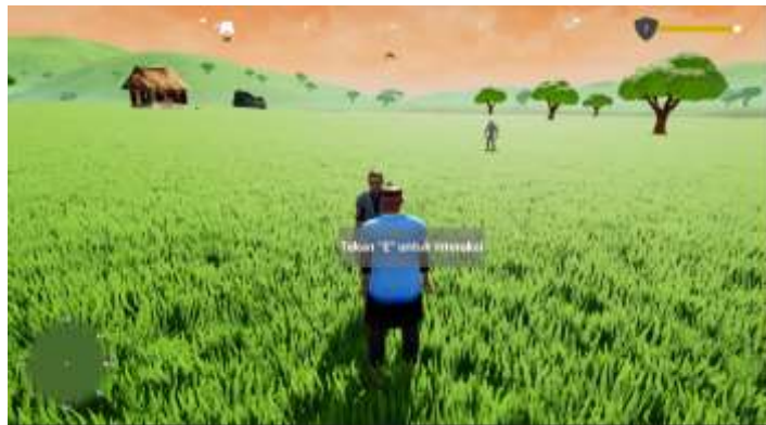
Gambar 9. Tampilan Instruksi Interaksi

Gambar 9 merupakan tampilan yang berfungsi untuk memberikan informasi kepada pengguna bahwa karakter NPC tersebut dapat melakukan interaksi dengan karakter utama.