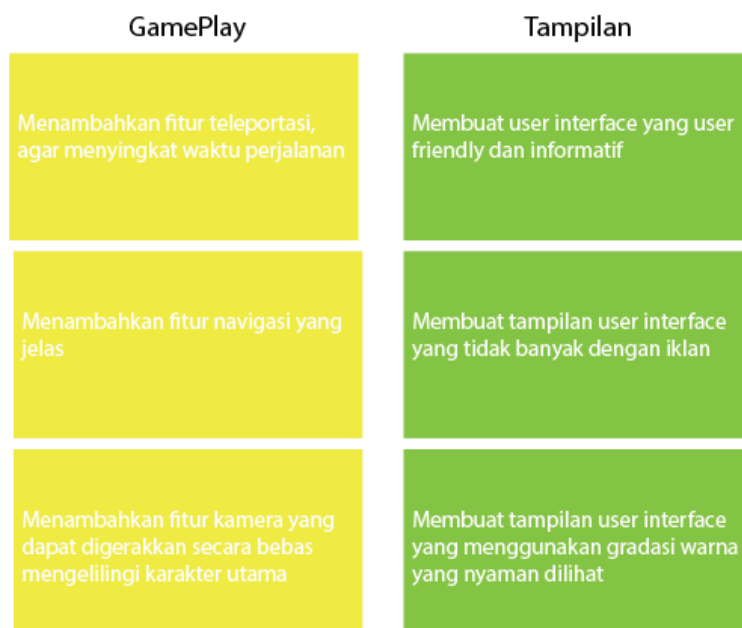
Gambar 3. Affinity Map Solusi

Pada tahapan ini menggunakan informasi sebelumnya untuk menghasilkan ide. Selama tahap brainstorming , dapat menghasilkan ide-ide yang menjadi solusi dari masalah yang akan dipecahkan pengguna. Ide-ide yang telah dikumpulkan akan diseleksi untuk menentukan solusi yang terbaik untuk memecahkan masalah, hal ini dapat dibuat dalam bentuk Affinity Map [13].