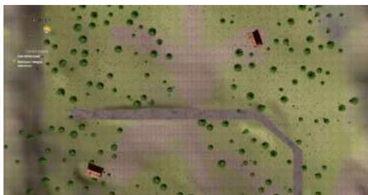
Gambar 13. Tampilan Peta

Pada gambar 13 merupakan tampilan yang berfungsi untuk memberikan informasi tentang peta dunia didalam game tersebut. Selain menampilkan peta, tampilan ini juga menampilkan informasi waktu pada dunia game tersebut dan juga menampilkan informasi tentang quest atau misi yang sedang dikerjakan oleh karakter utama.