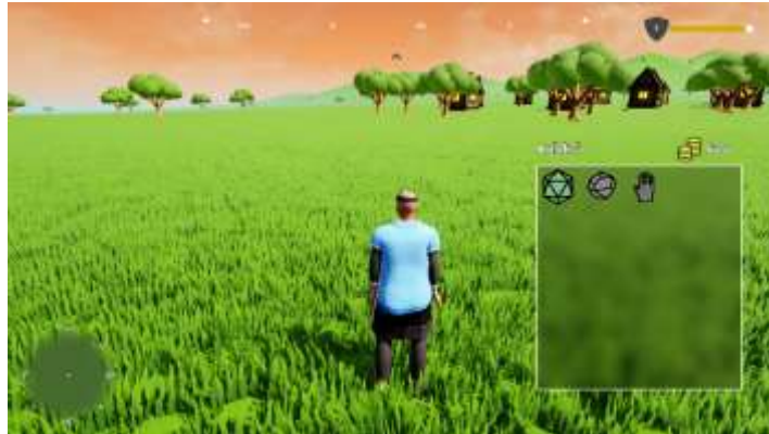
Gambar 11. Tampilan Koleksi