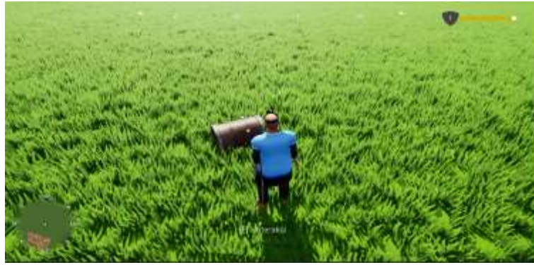
Gambar 14. Tampilan Buka Peti