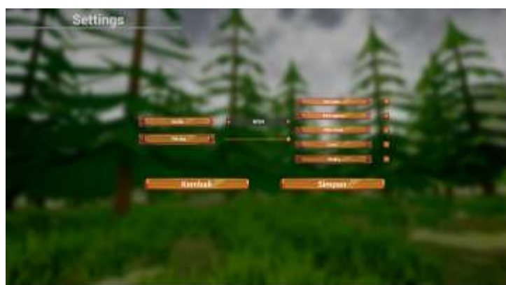
Gambar 6. Tampilan Pengaturan

Pada gambar 6 merupakan tampilan pengaturan yang memiliki beberapa fitur, seperti fitur grafik yang berfungsi untuk mengatur kualitas grafik dari game yang memiliki 3 pilihan yaitu Low , Medium , dan High . Kemudian ada fitur volume yang berfungsi untuk mengatur suara dari game. Selanjutnya ada fitur kompas yang berfungsi untuk menampilkan atau menyembunyikan tampilan kompas pada game play . Kemudian ada fitur peringatan yang berfungsi untuk menampilkan atau menyembunyikan informasi peringatan pada game play . Selanjutnya fitur peta kecil yang berfungsi untuk menampilkan atau menyembunyikan tampilan peta kecil pada game play . Kemudian ada fitur level yang berfungsi untuk menampilkan atau menyembunyikan informasi level pada game play . Kemudian ada fitur waktu yang berfungsi untuk menampilkan atau menyembunyikan informasi waktu pada game play .