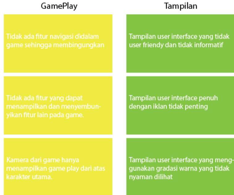
Gambar 2. Affinity Map Permasalahan

produk. Idealnya, pada tahap ini akan mengidentifikasi masalah yang nantinya akan menjadi fokus saat mengembangkan prototipe desain user interface [11]. Setelah melakukan tahapan empati. Langkah selanjutnya yaitu menyusun setiap jawaban dari responden agar memudahkan dalam membuat affinity map . Affinity Map merupakan teknik yang dilakukan dalam proses user research untuk memperoleh berbagai informasi dan peluang [12].