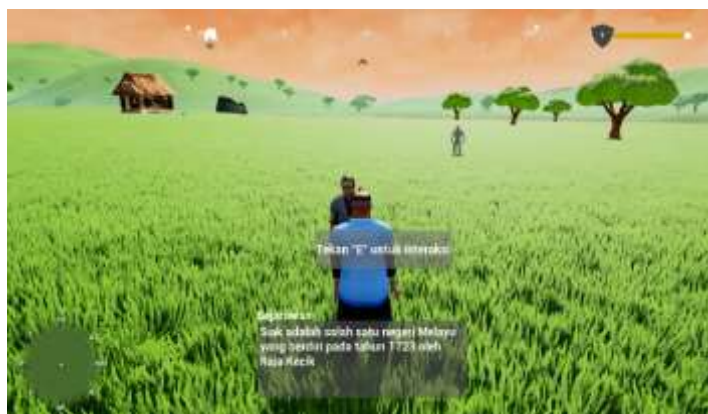
Gambar 10. Tampilan Interaksi

Pada gambar 10 merupakan tampilan yang menampilkan interaksi antara karakter utama dan karakter npc.