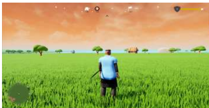
Gambar 7. Tampilan Game Play

Gambar 7 merupakan tampilan game play yang menampilkan beberapa fitur seperti Health Point (HP) dan Experience Point (EXP) karakter utama yang berfungsi memberikan informasi tentang keadaan karakter saat ini. Kemudian ada fitur kompas yang memudahkan dalam menemukan lokasi misi ataupun hadiah. Selanjutnya ada fitur peta kecil yang berfungsi memberikan informasi tentang lokasi karakter.