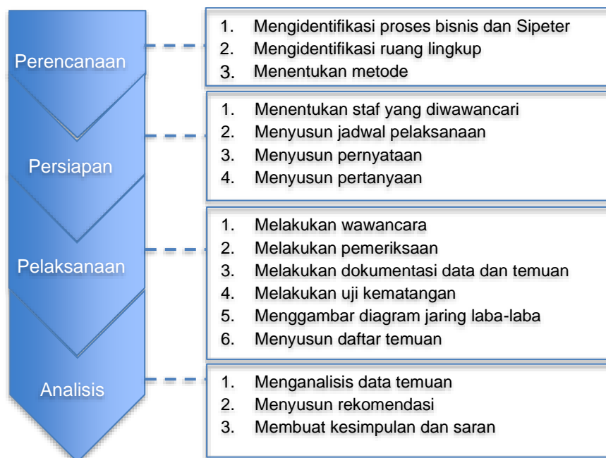
Gambar 1. Tahapan dan Sub Tahapan Penelitian

Tahapan proses yang dilakukan dalam penelitian ini terdiri dari empat tahapan utama [4], yaitu: perencanaan, persiapan, pelaksanaan, dan analisis keamanan informasi Sipeter. Masing-masing tahapan utama tersebut memiliki sub tahapan proses yang dapat dilihat selengkapnya pada Gambar 1.