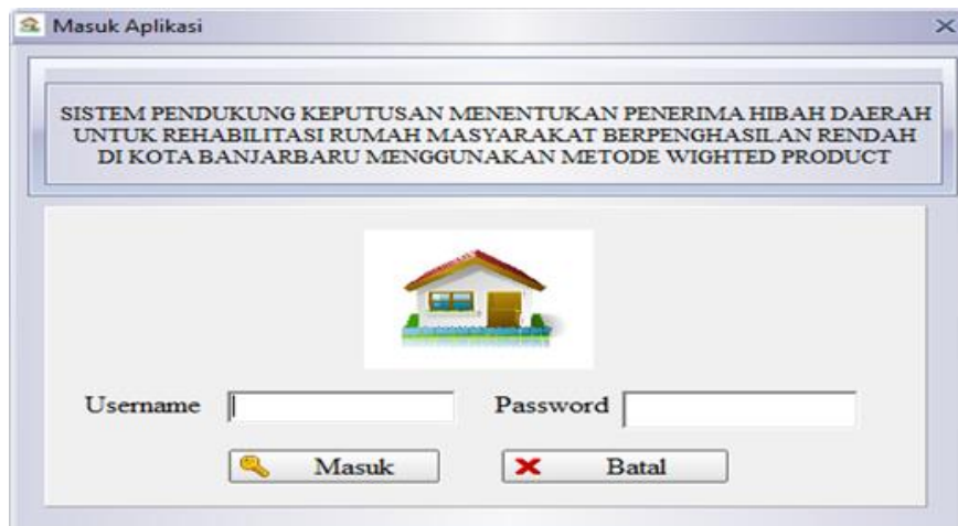
Gambar 4.1 Form Login

Berikutnya dibuat Form menu utama memiliki menu seluruh program setelah admin berhasil akses masuk aplikasi maka seluruh menu aktif. Menu utama digunakan untuk mengendalikan seluruh menu dan sub menu yang ada pada aplikasi ini. Pada menu utama terdapat 7 menu yaitu data master, proses, laporan, fasilitas dan tombol keluar untuk kembali ke login akses masuk.