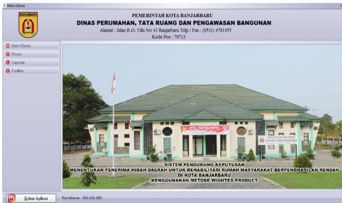
Gambar 4.2 Form Menu Utama

Berikutnya dibuat Form menu utama memiliki menu seluruh program setelah admin berhasil akses masuk aplikasi maka seluruh menu aktif. Menu utama digunakan untuk mengendalikan seluruh menu dan sub menu yang ada pada aplikasi ini. Pada menu utama terdapat 7 menu yaitu data master, proses, laporan, fasilitas dan tombol keluar untuk kembali ke login akses masuk.