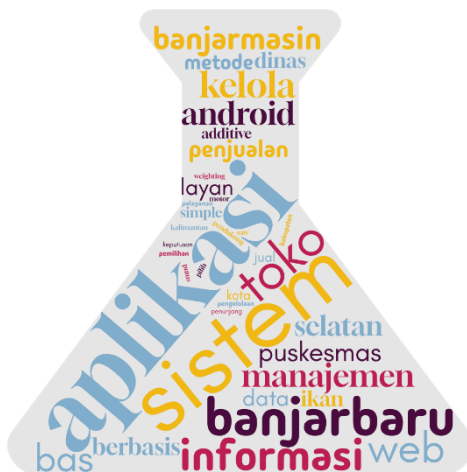
Gambar 3. Visualisasi Topik SI

Topik skripsi Sistem Informasi divisualisasikan dalam bentuk wordcloud berikut: